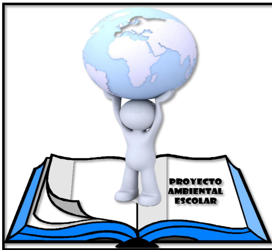
Imagen 1. Logo para el proyecto ambiental en la Institución Educativa Técnica San Ignacio

El logo del proyecto se establece, con el fin de formar niños y ciudadanos conscientes de vivir en un ambiente escolar sano.